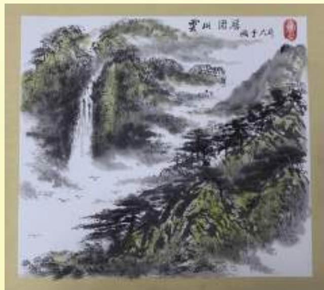
孔宪玉《云山固居》绘画类第三名